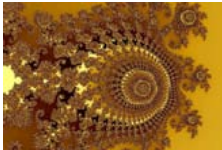
Transparenz schafft Vertrauen